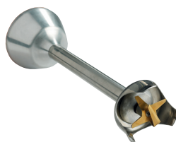
Couteau émulsionneur Réf. : AC520