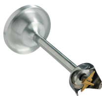
Couteau émulsionneur Réf. : AC530