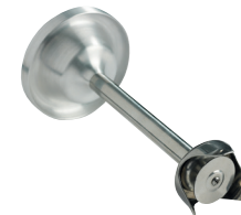
Disque batteur Réf. : AC532