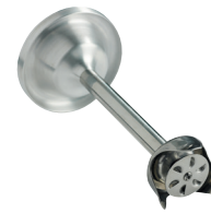
Disque émulsionneur Réf. : AC533