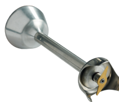
Couteau standard 2 lames Réf. : AC521