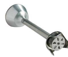
Disque émulsionneur Réf. : AC523