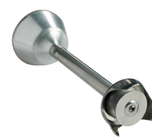
Disque batteur Réf. : AC522